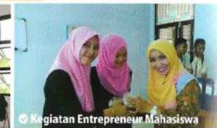
📌 Kegiatan Entrepreneur Mahasiswa