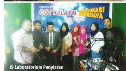
📌 Laboratorium Penyiaran