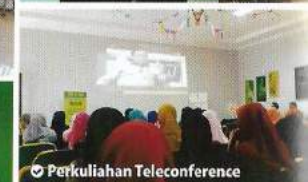
📌 Perkuliahan Teleconference