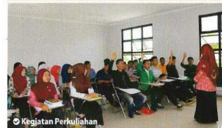
📌 Kegiatan Perkuliahan